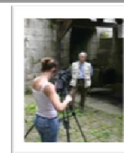
Conférence, octobre 2008