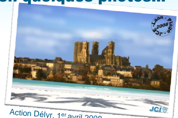
Action Délyr, 1 er avril 2008