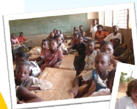
Ouagadoudou, mai 2008