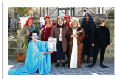
Chasse eau trésor Journées du patrimoine 2008